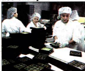
Lancement gourmand de l'opération à la chocolaterie Castelain, sise à Châteauneuf-du-Pape.